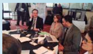
Taller Vehículo Eléctrico y Almacenamiento de Energía San José, Costa Rica