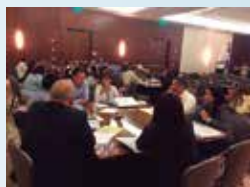
Seminario RRHH. Santo Domingo - República Dominicana