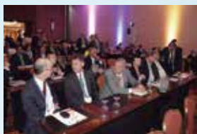
Reunión de Altos Ejecutivos 50, San José - Costa Rica