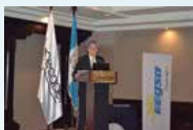
Seminario GEFIES Antigua - Guatemala