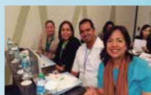
Taller Estrategias de Comunicaciones de Marketing, Santo Domingo - República Dominicana