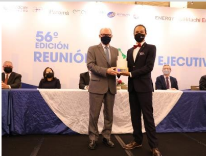
1° puesto: TRECSA – Guatemala