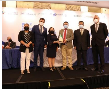
2° puesto: ELECTRONOROESTE – Perú