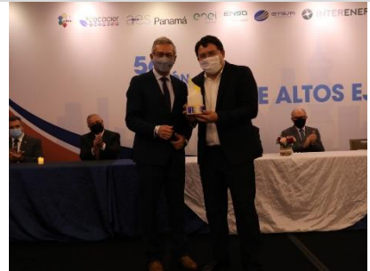
3° puesto: COPEL Distribuição – Brasil