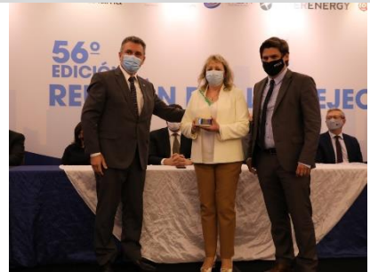
3° puesto: UTE - Uruguay