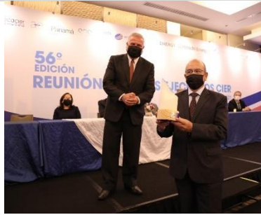
2° puesto: CENACE – Ecuador