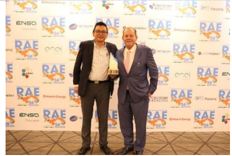
3° puesto ESPH – Costa Rica