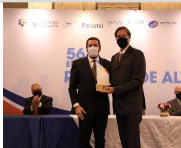
ISA – Colombia