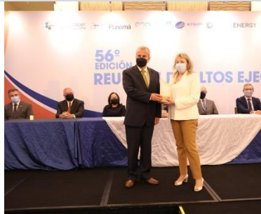
2° puesto: UTE – Uruguay