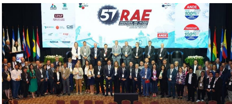
Autoridades de CIER y representantes de las empresas y proyectos premiados con el Premio CIER de Innovación 2022, en la Ceremonia de Premiación conjunta que se realizó del Premio CIER de Innovación y del Premio CIER de Satisfacción de Clientes.