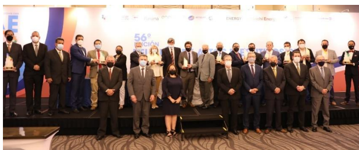
Autoridades de CIER y representantes de las empresas y proyectos premiados con el Premio CIER de Innovación 2021, en la Ceremonia de Premiación.