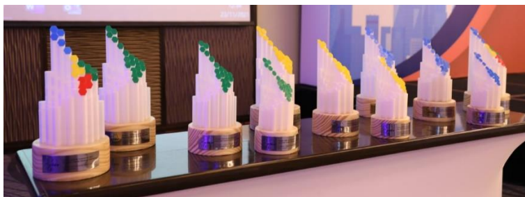
Trofeos entregados a los vencedores del Premio CIER de Innovación