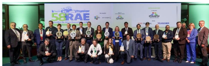
Autoridades de CIER y representantes de las empresas y proyectos premiados con el Premio CIER de Innovación 2023, en la Ceremonia de Premiación conjunta que se realizó del Premio CIER de Innovación y del Premio CIER de Satisfacción de Clientes.